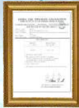
Far Infrared Ray