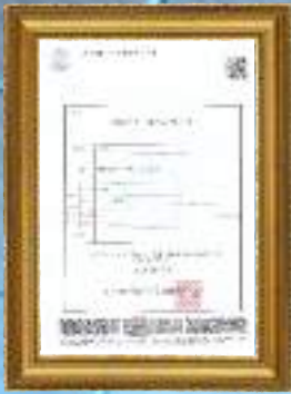
Manufacture Medical Device